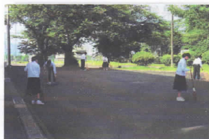
環境委員の朝清掃