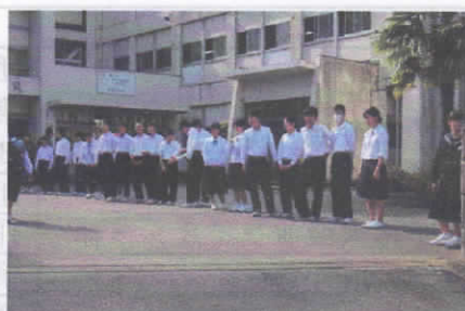
生活委員・生徒会本部役員のあいさつ運動