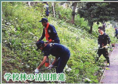
学校林の活用推進