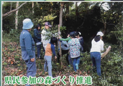
県民参加の森づくり推進