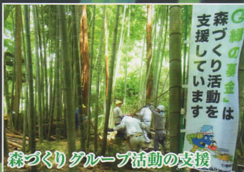
森づくりグループ活動の支援