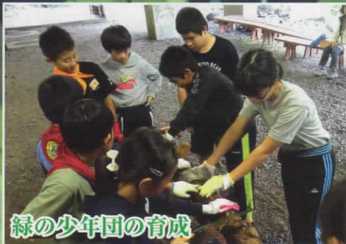
緑の少年団の育成